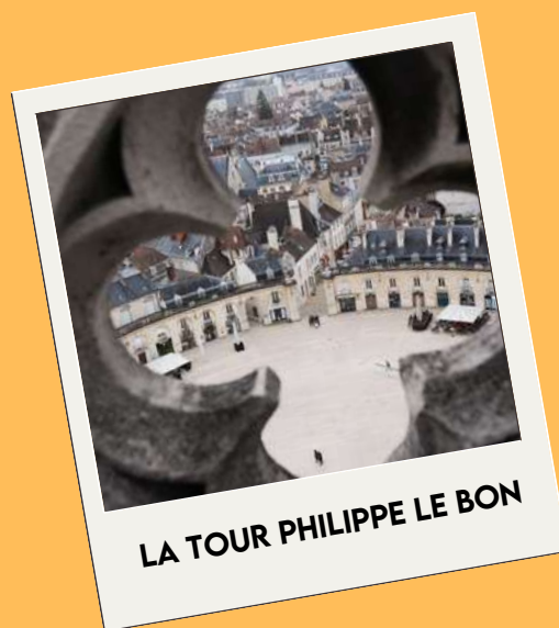
LA TOUR PHILIPPE LE BON