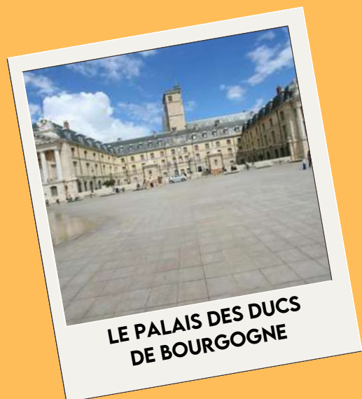
LE PALAIS DES DUCS DE BOURGOGNE