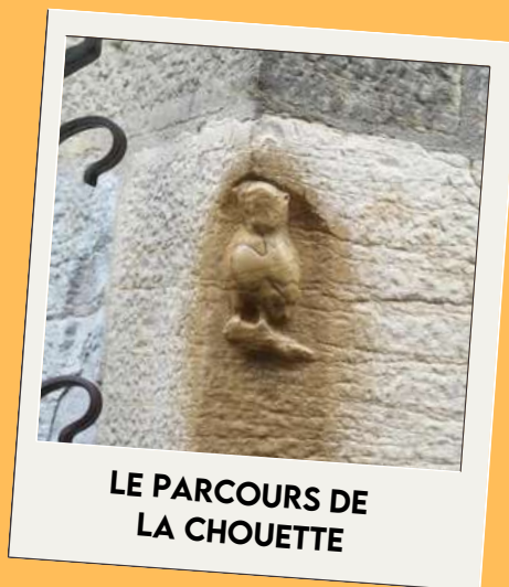
LE PARCOURS DE LA CHOUETTE