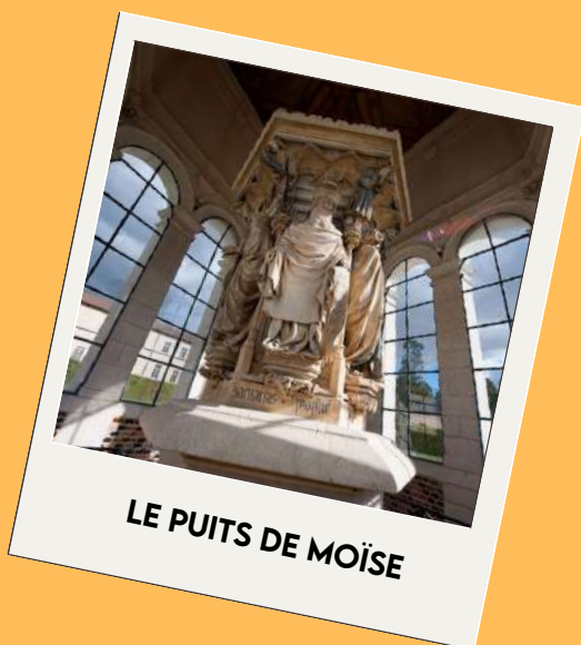
LE PUIS DE MOÏSE